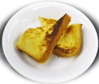
フレンチトースト