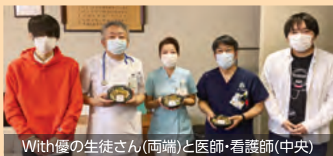
With優の生徒さん(両端)と医師・看護師(中央)

5月7日にNPO法人With優(米沢市)から新型コロナウイルスと向き合う当院の職員を応援するため、山菜天丼が提供されました。