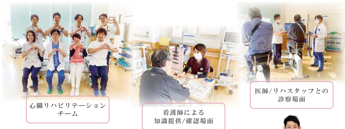
心臓リハビリテーション チーム