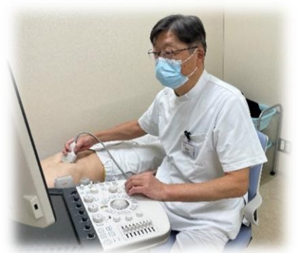
隅々までチェック中…